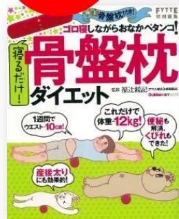
「寝るだけ! 骨盤枕ダイエット」 (学研パブリッシング)