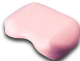
プロイデア 「スリムクッション」