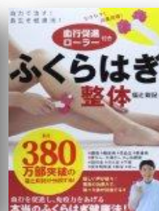
「血行促進ローラー付き ふくらはぎ整体」 (新星出版社)