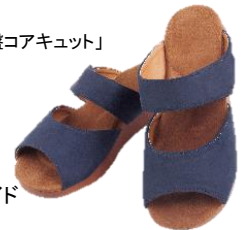
プロイデア 「福辻式 S字ウォークガイド サンダル WALKTIVE」