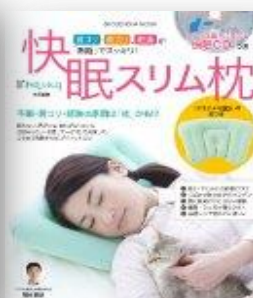
「快眠スリム枕」 (祥伝社)