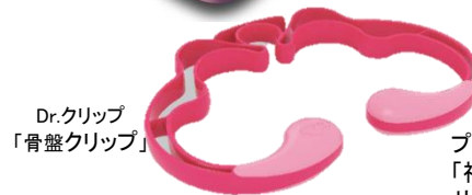
Dr.クリップ 「骨盤クリップ」