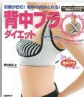
「背中ブラダイエット」 (角川マガジズ)