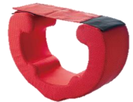
プロイデア 「福辻式 寝ながら骨盤コアキュット」