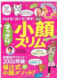
「すっきり小顔スリム」 (ポプラ社)